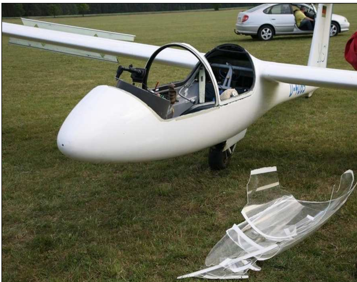
4 – Szybowiec bezpośrednio po wypadku – widoczne zniszczone oszklenie ostony kabiny obok szybowca oraz wypuszczone hamulce aerodynamiczne (zbliżenie).