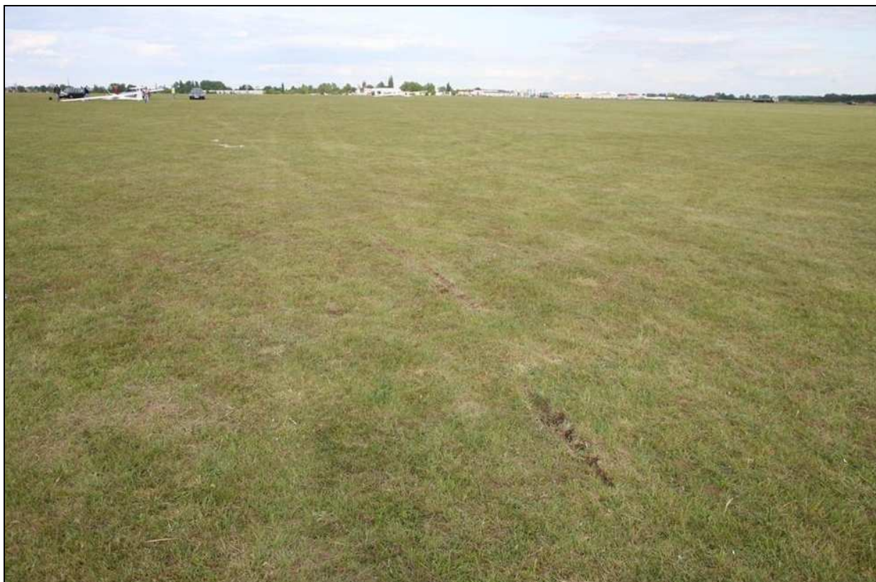
1 – Ślad pierwszego zderzenia szybowca z nawierzchnią lotniska.