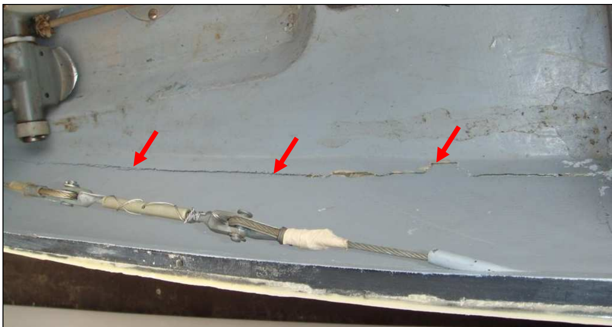
9 – Pęknięcie spodu kadłuba wskazane strzałkami.