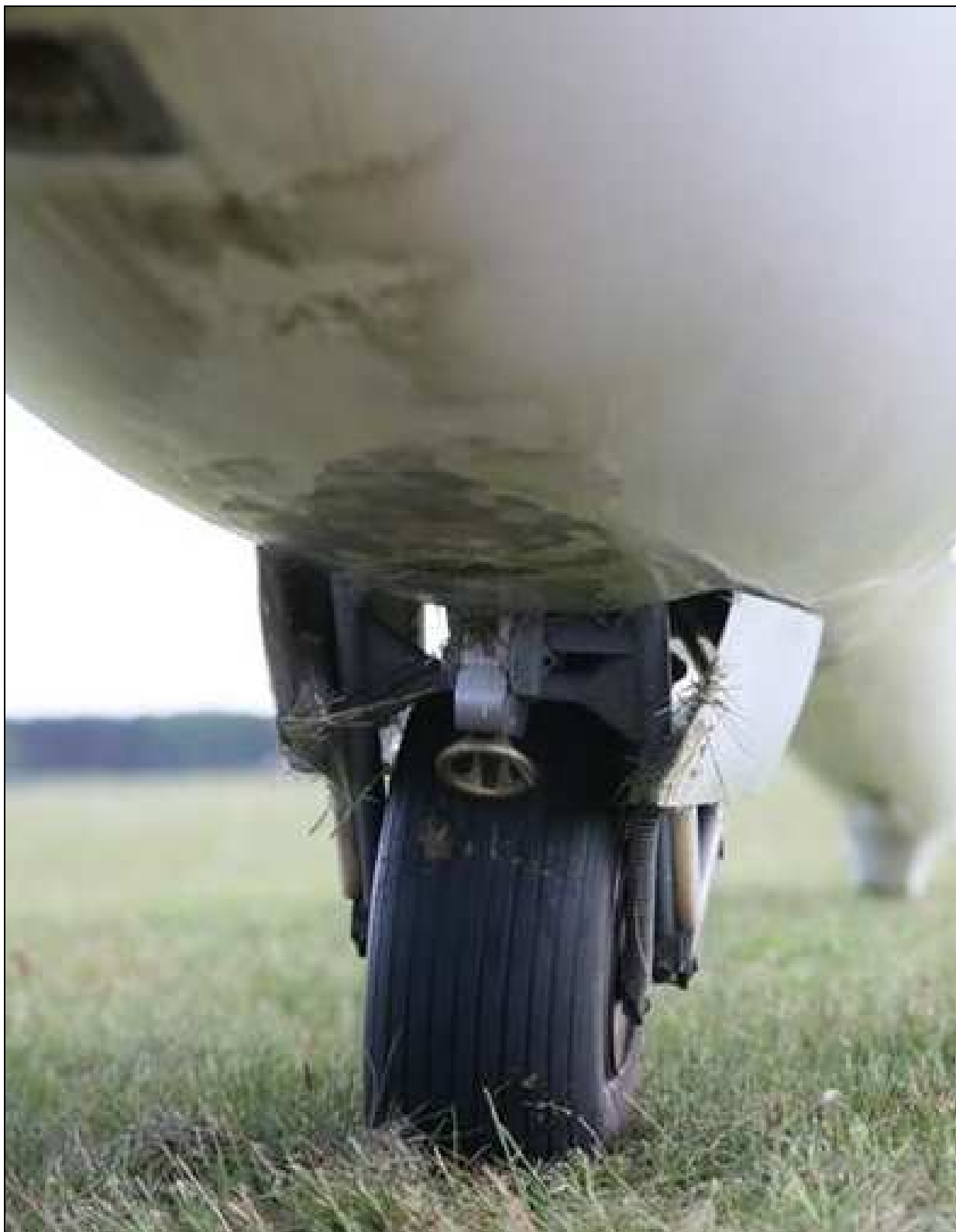
6 – Uszkodzenia spodniej części kadłuba – widoczne ślady tarcia spodu kadłuba o murawę lotniska. Ślady trawy na pokrywach luku podwozia świadczą o lądowaniu z zamkniętym podwoziem.