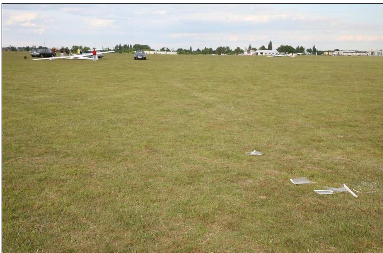
2 – Fragmenty oszklenia osłony kabiny uszkodzonej w wyniku zderzenia szybowca z nawierzchnią lotniska.