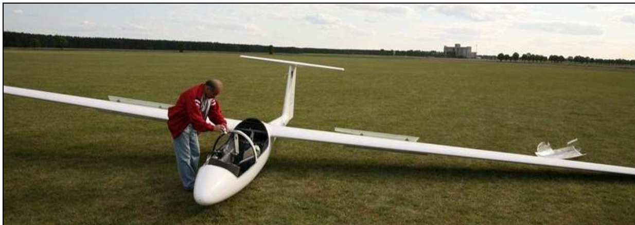
3 – Szybowiec bezpośrednio po wypadku – widoczne zniszczone oszklenie ostony kabiny obok szybowca oraz wypuszczone hamulce aerodynamiczne.