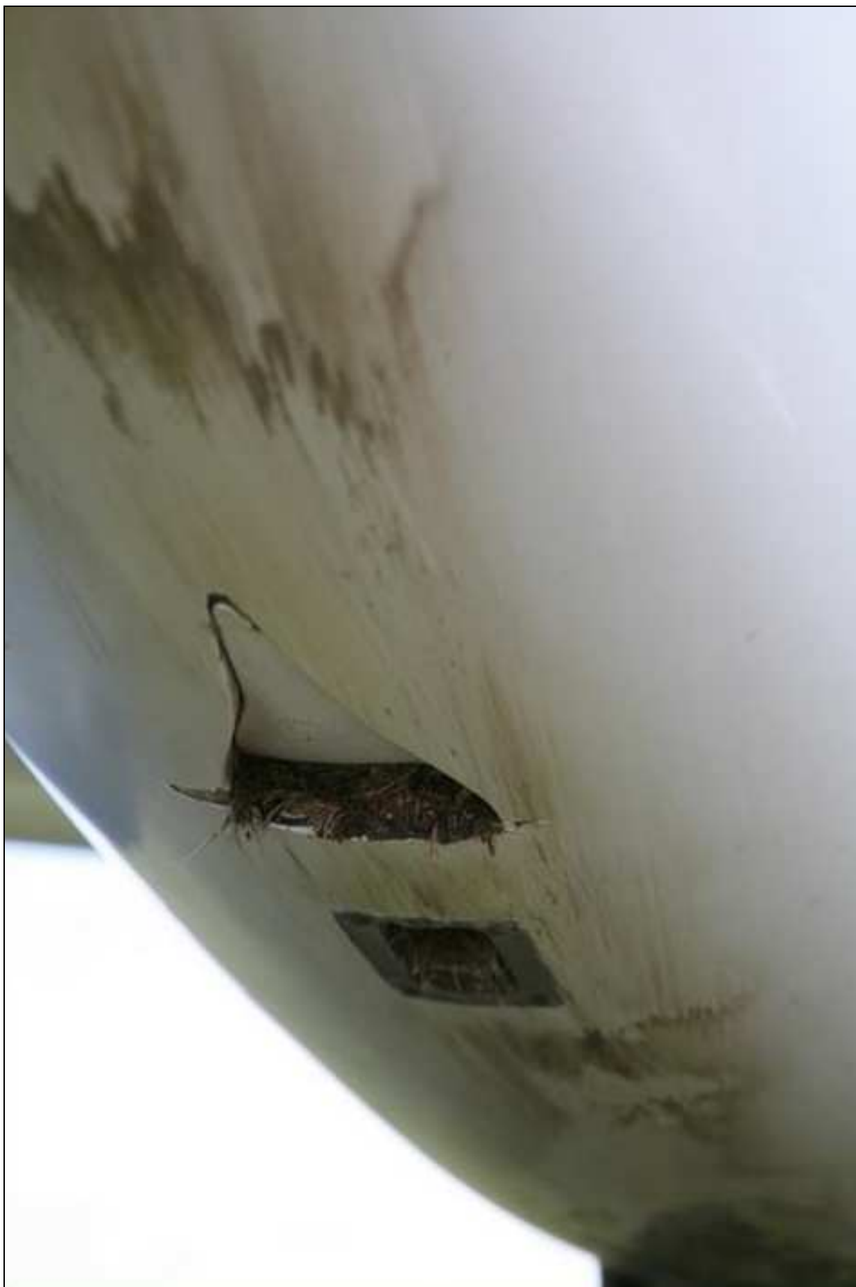
6 – Uszkodzenia spodniej części kadłuba – widoczne ślady tarcia spodu kadłuba o murawę lotniska oraz ślady murawy we wlocie powietrza.