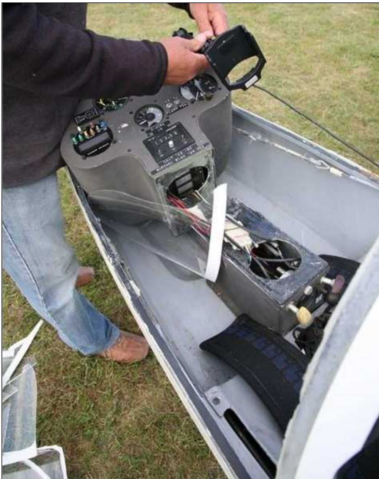
5 – Ogólny widok na kabinę z odchylną tablicą przyrządów.