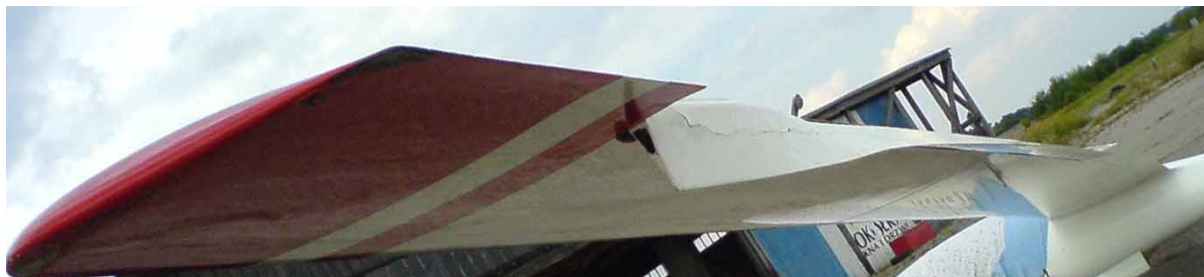
5 – Uszkodzenia lewej lotki.