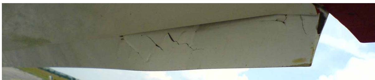
7 – Uszkodzenia lewej lotki. Widoczne ślady roślinności na dolnej powierzchni skrzydła.