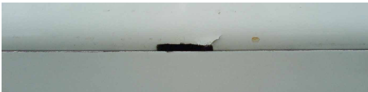
10 – Uszkodzenia prawej lotki – okolica środkowego okucia zawieszenia.