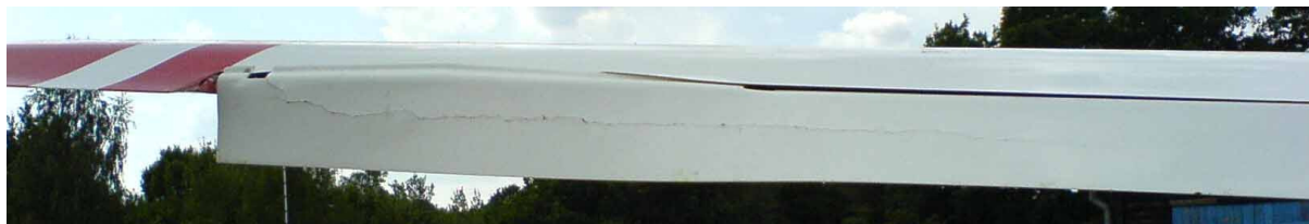
4 – Uszkodzenia lewej lotki.