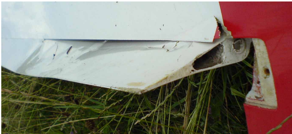
9 – Uszkodzenia prawej lotki przy końcówce.