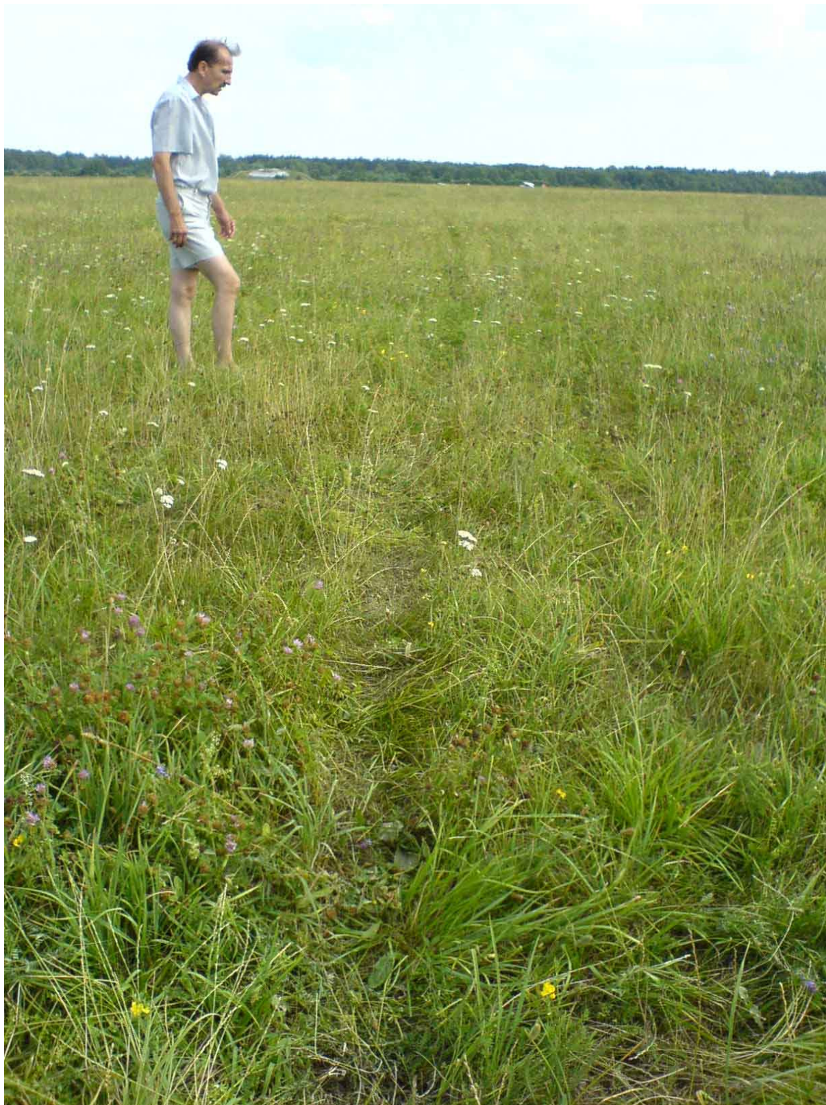
3 – Ślad kadłuba szybowca w ostatniej fazie dobiegu, podczas ruchu ogonem do przodu.