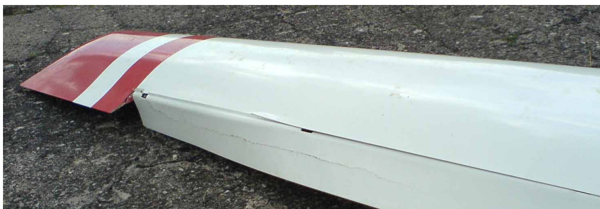
8 – Uszkodzenia lewej lotki i pokrycia skrzydła.