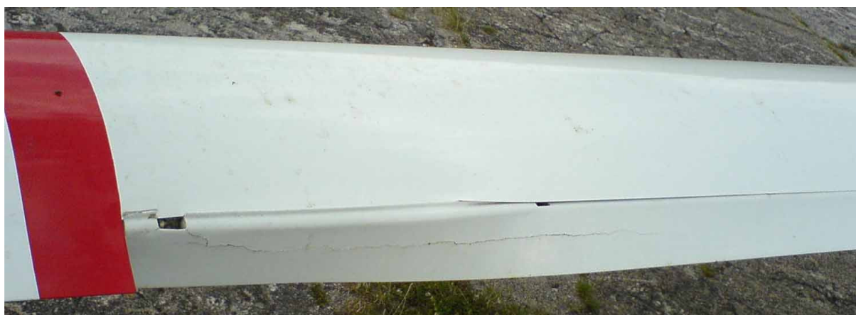
6 – Uszkodzenia lewej lotki i pokrycia skrzydła.