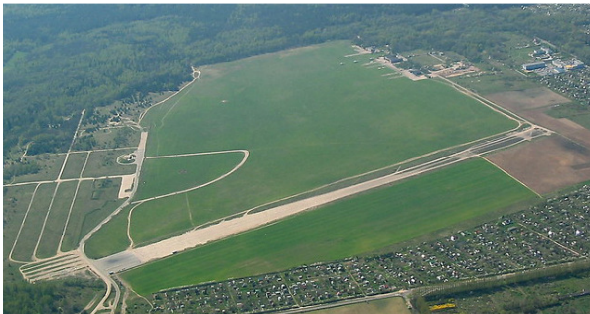
1 – Zdjęcie lotnicze lotniska Białystok-Krywlany i okolicy.